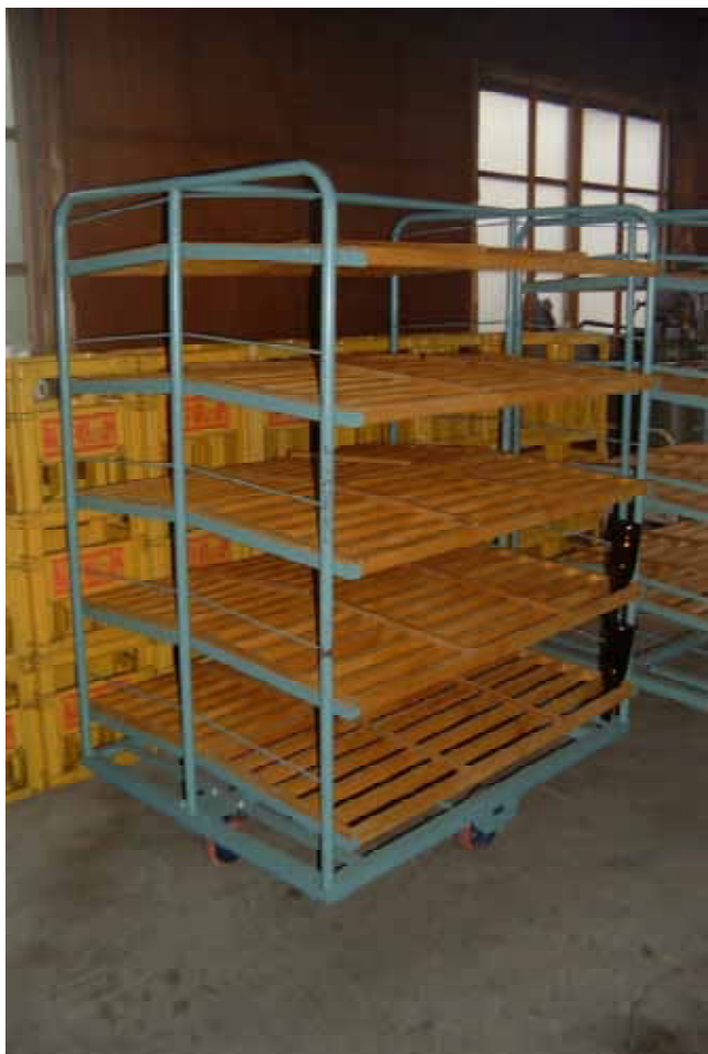
木枠10段 標準タイプ