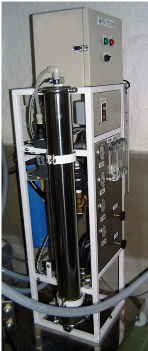
逆浸透膜方式浄水機 MPW-7500