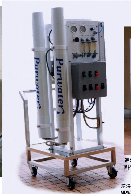
逆浸透膜方式浄水機 MPW-60000 ↑