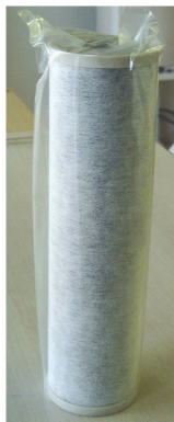
活性炭カートリッジとハウジング 3本用と1本用