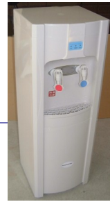
ウォーターサーバー