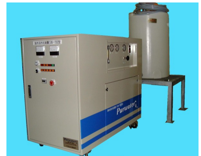
海水淡水化装置 SW-150 醸造機械・酒具