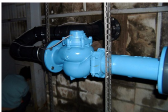
井戸水用塩素注入機/工事一式

弊社は20年前に逆浸透膜を扱って以来様々な水濾過機/周辺機器を扱ってまいりました。お客様のニーズに合わせて水濾過のシステムをご提案いたします