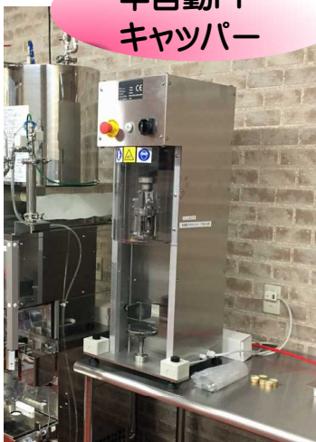
半自動PP キャツパー