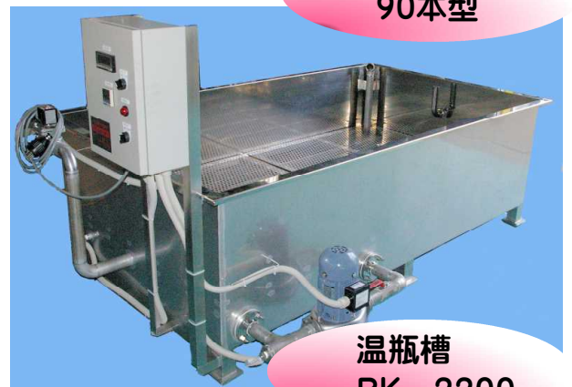
温瓶槽 BK - 2200