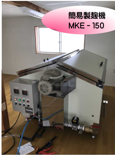
簡易製麹機 MKE - 150