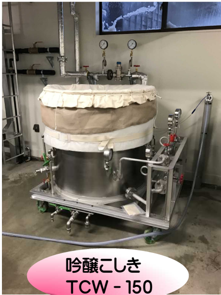
吟醸こしき TCW - 150