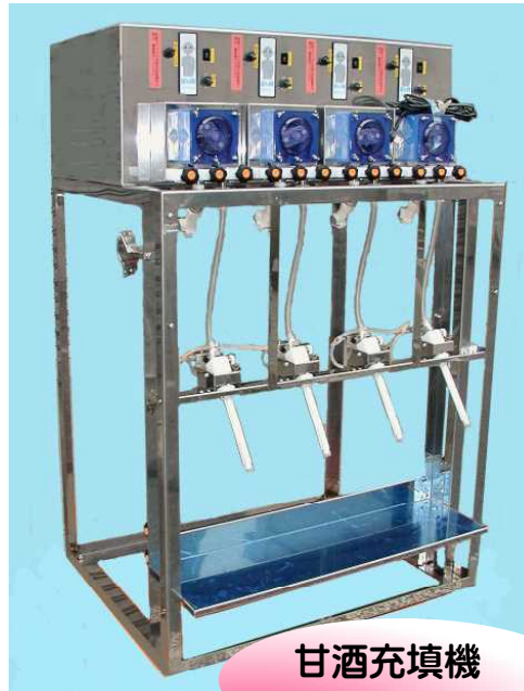
甘酒充填機 NEWB - 4