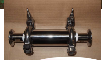
金属キャッチャー Sタイプ