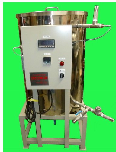
びん太ヒーター BH - 35