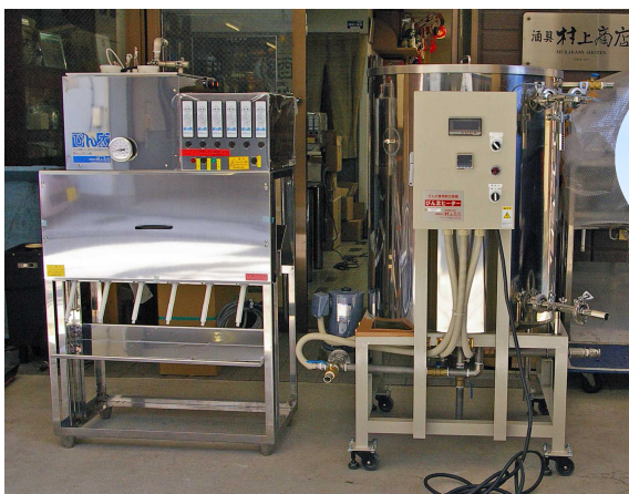
簡易充填機びん太B - 6とBH - 35DX