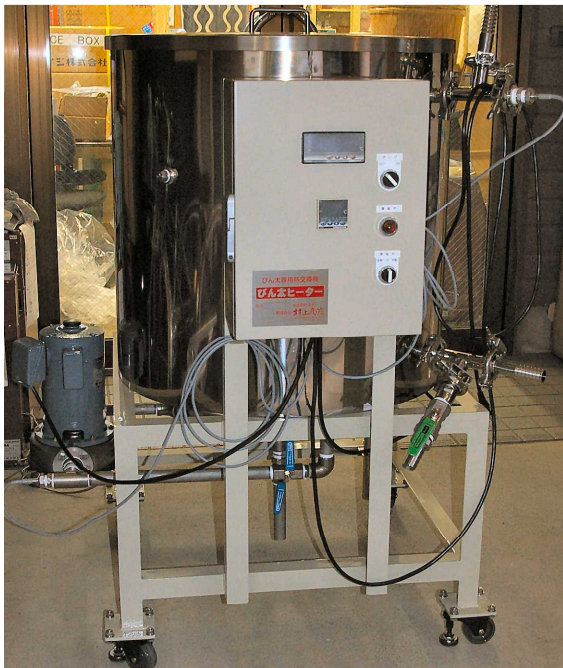
びん太ヒーターBH - 25DX 巾650×奥行850×高さ1150