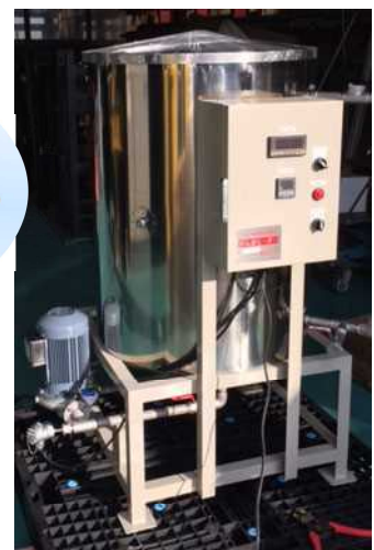
びん太ヒーター BH - 35DX 巾700×奥行920× 高さ1300